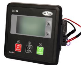
Tableau SCO 5